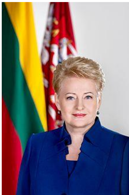
Президент Литви Даля Ґрібаускайте – Голова Ради