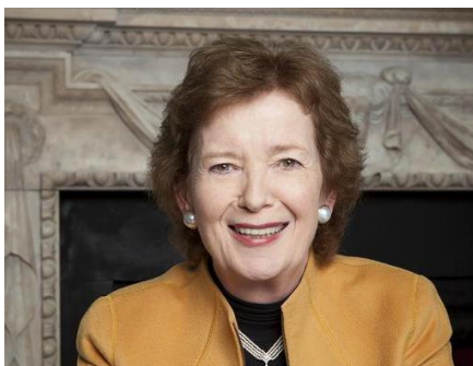
Мері Робінсон Президентка Ірландії (1990 – 1997)