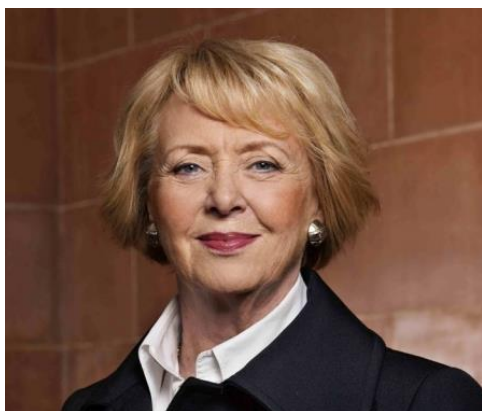
Вігдіс Фіннбоґадоттір Президентка Ісландії (1980 – 1996), перша жінка у світі, яка була демократично обрана на посаду Президента

Мережа була заснована у 1996 році трьома жінками-лідерками